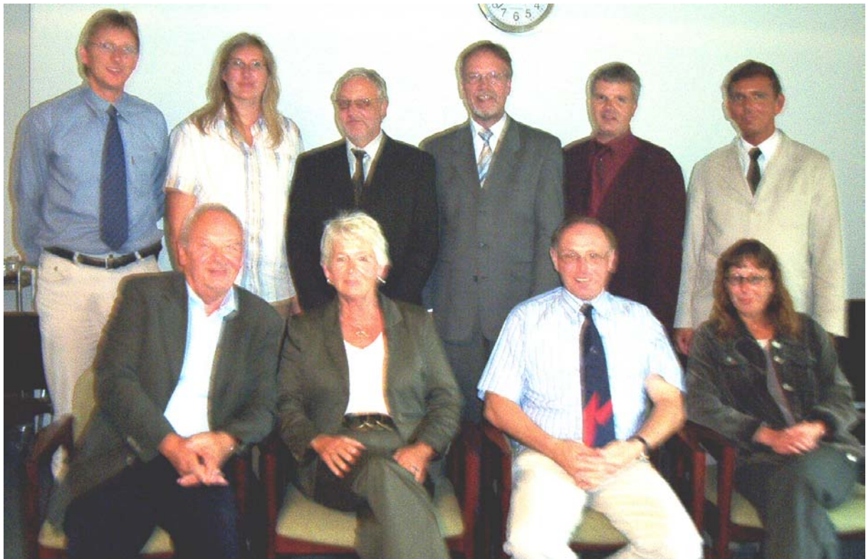
K.I.L.O. –Netzwerktreffen am 1. September 2004 in Molfsee

Das zweite Treffen fand am 1. September 2004 im Amt Molfsee statt und auch das dritte Treffen ist bereits geplant.